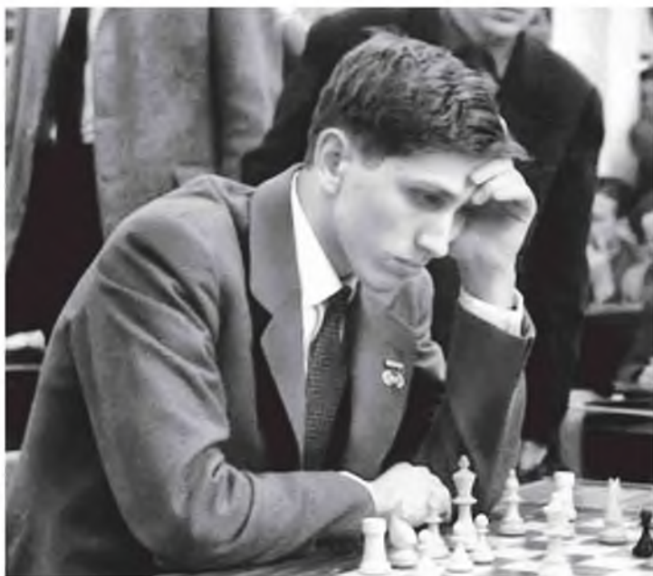
На чемпионате мира в Лейпциге в 1960 году. Бобби Джеймс Фишер. 17 лет.

Когда ему исполнилось 7 лет, родители отвели его к тренеру по шахматам. Этот тренер числился в десятке лучших шахматистов США. Когда тренер с Робертом сел играть партию на шахматной доске, он увидел всю мощь игры мальчика. Он предложил Роберту закончить игру между ними в ничейной позиции, но юный шахматный гений не согласился и играл до конца. В 7 лет Бобби сыграл с шахматистом, который состоял в десятке лучших шахматистов Америки, вничью. Позже он сыграл с более сильными соперниками, а затем в 13 лет он выиграл звание чемпиона США по шахматам.